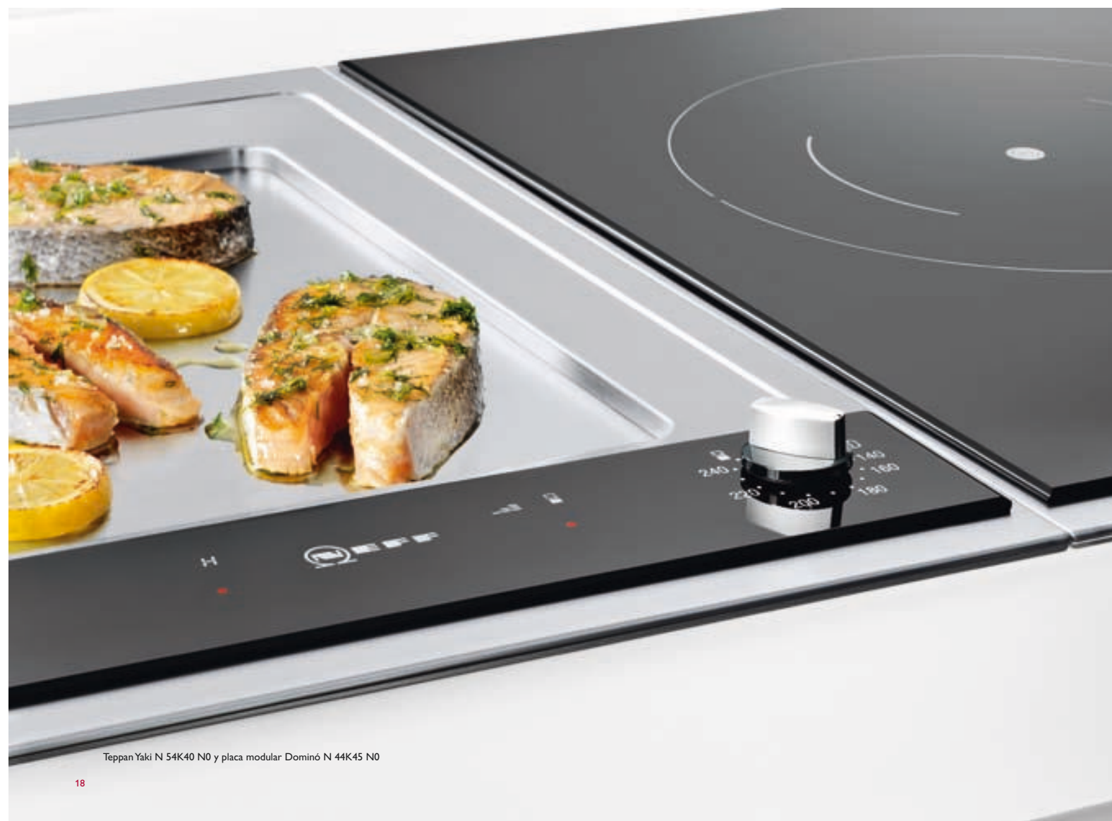
Teppan Yaki N 54K40 N0 y placa modular Dominó N 44K45 N0

Gracias a la versatilidad de la tecnología Neff, las combinaciones que se pueden hacer con el Teppan Yaki son infinitas. Por ejemplo, ahora es posible añadir el Teppan Yaki a una placa de 3 fuegos de inducción Neff, con la comodidad del mando TwistPad y disfrutar de todos los sistemas de cocción a la vez para lograr combinaciones realmente innovadoras con un sofisticado toque oriental.