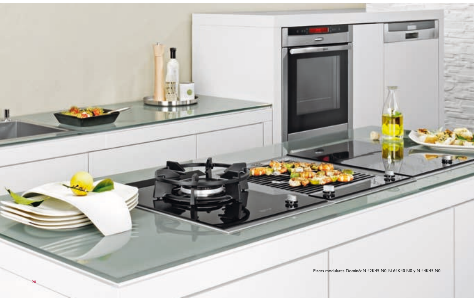
Placas modulares Dominó: N 42K45 N0, N 64K40 N0 y N 44K45 N0