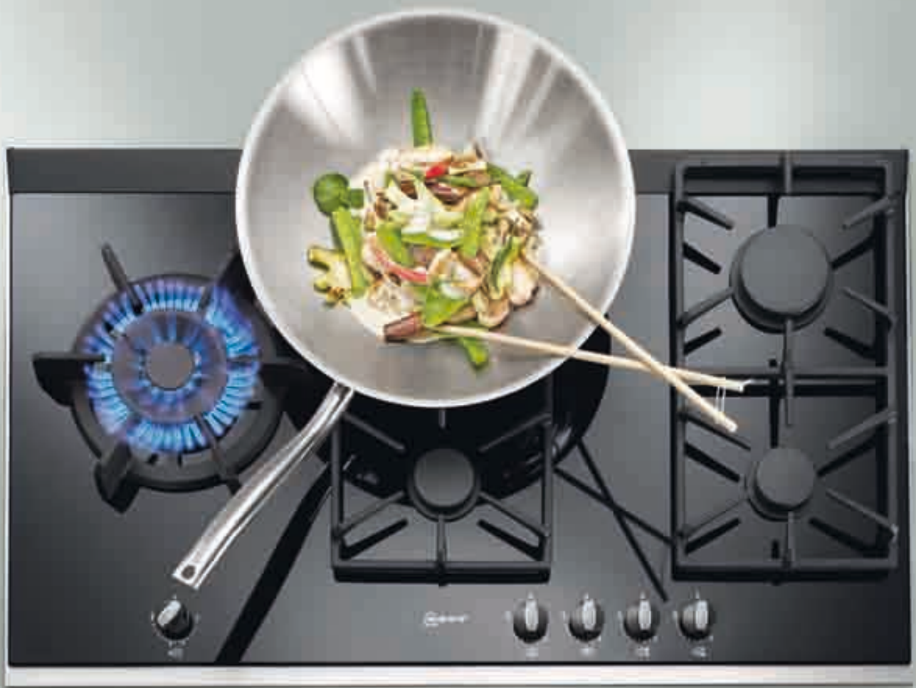
Placa de gas T 69S86 N0

Placa de gas con elegante diseño ▲ en cristal vitrocerámico y el nuevo marco con diseño profesional en acero inoxidable.